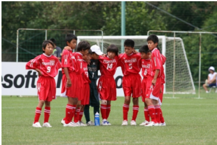
試合直前の緊張の一瞬

前日、覇気のない試合運びで痛恨の1敗をしたが今日は予選リーグ最終日！ 明日へつながる試合ができるか！熱い熱い戦いになりそうである！